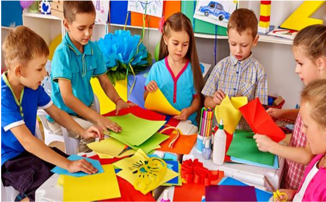
Anexo N°03: Aplicando la estrategia Creatividad y la Expresión Artística.