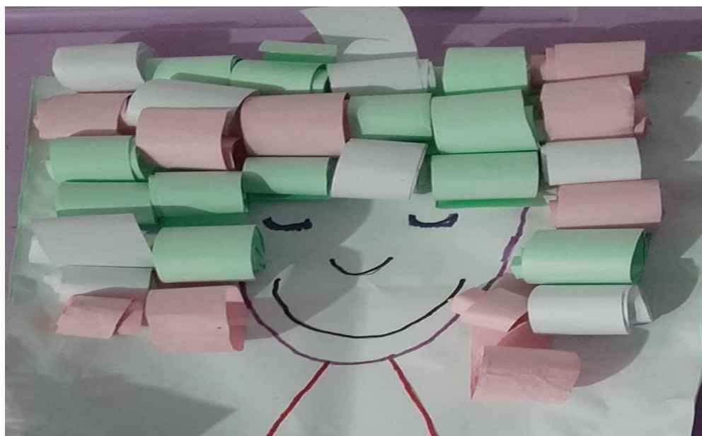
Figura 2: Trabajo culminado aplicando la técnica del enrollado