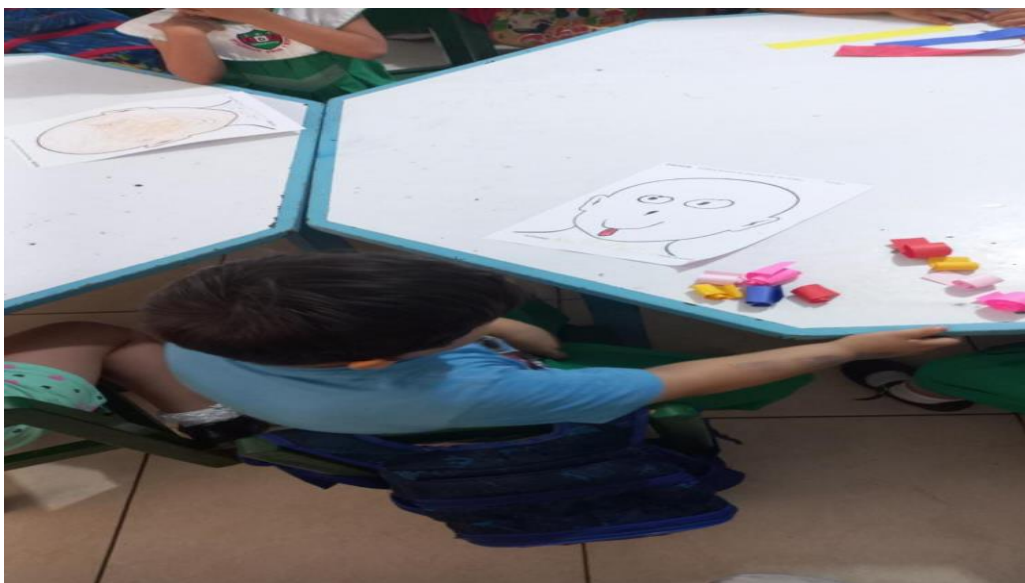
Figura 1: Niño de 5 años trabajando la técnica del enrollado