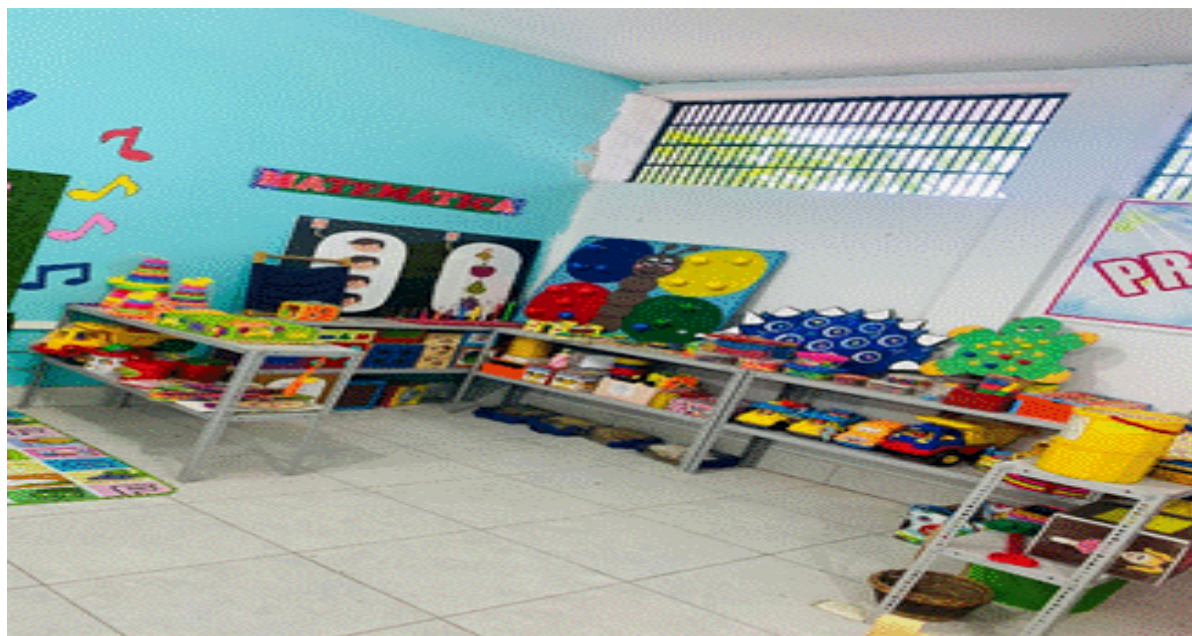
Figura 2: Sector juegos tranquilos del aula de recurso del Programa de Estudio de Educación