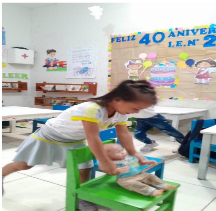
Figura 4: Niña de 5 años realizando juegos en el sector hogar