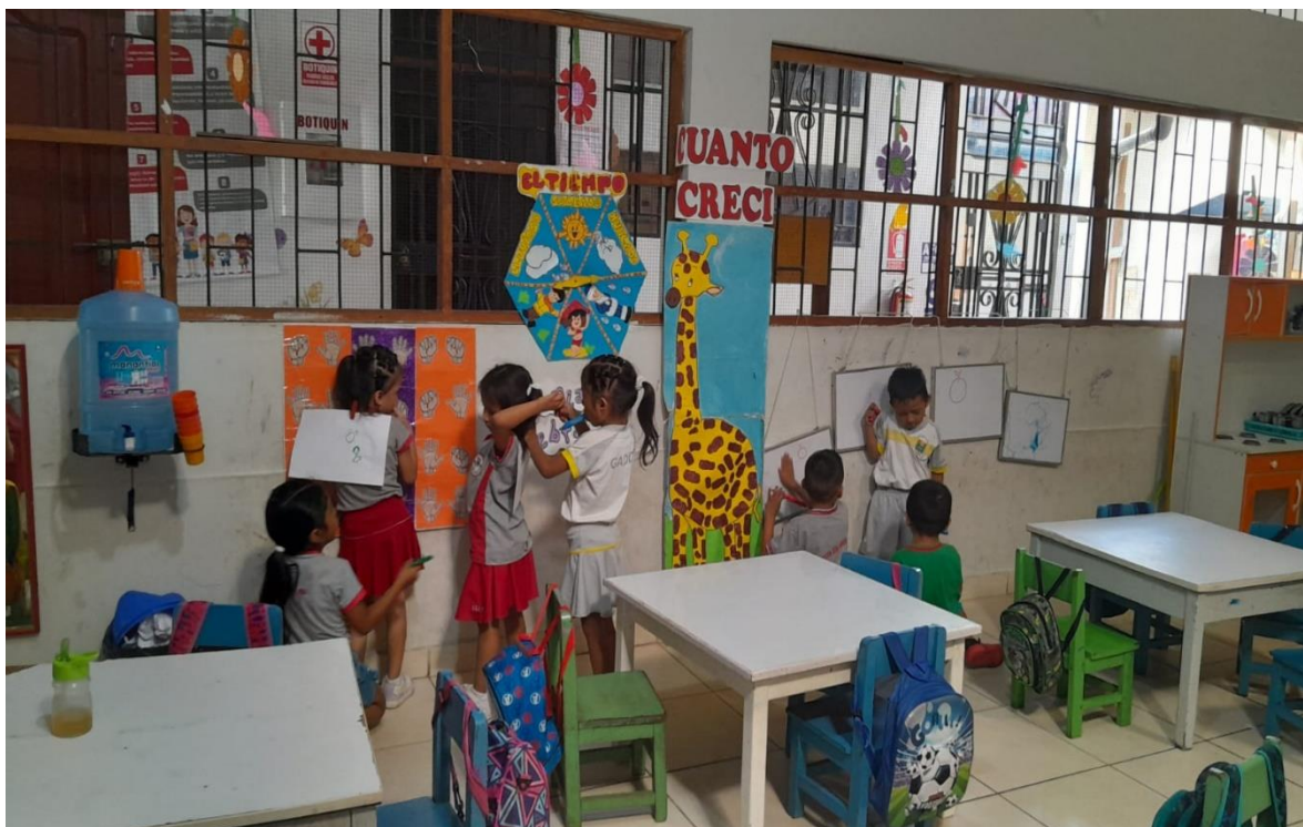
Figura 3: Niñas y niños de 5 años realizando juegos en el sector arte