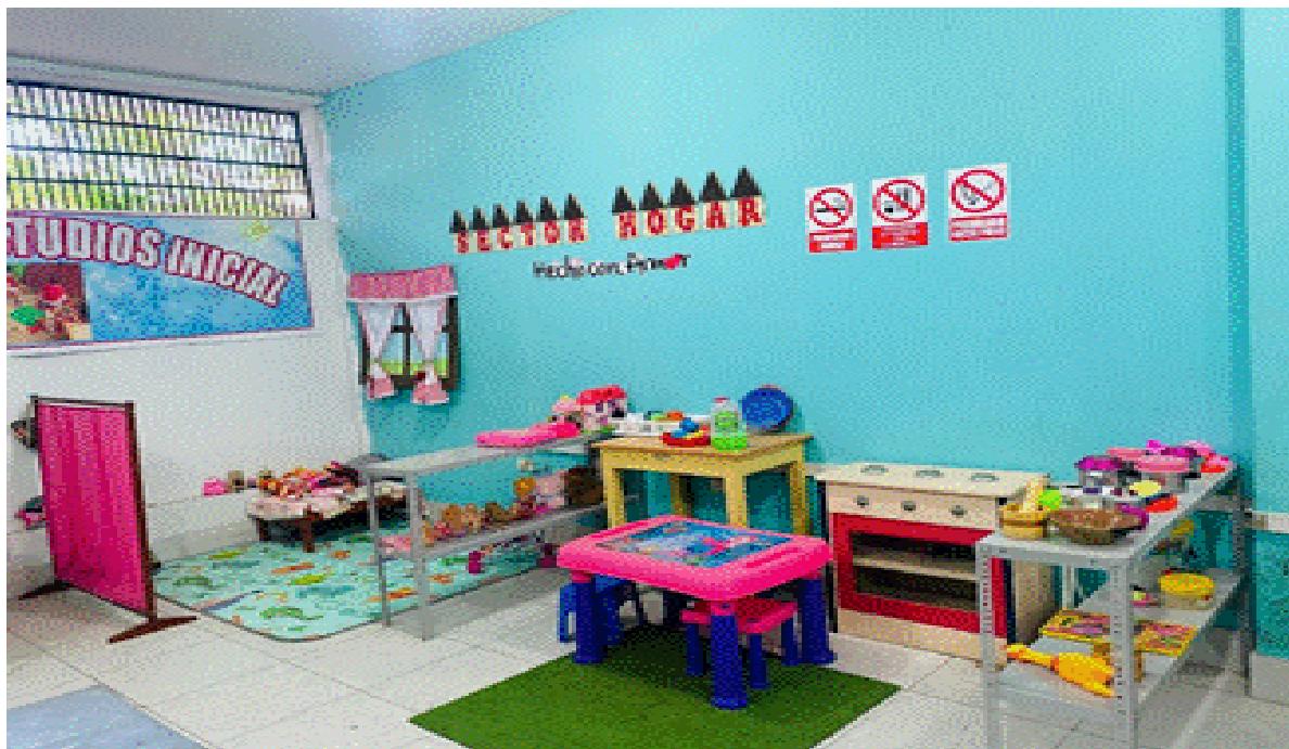
Figura 1: Sector hogar del aula de recurso del Programa de Estudio de Educación Inicial