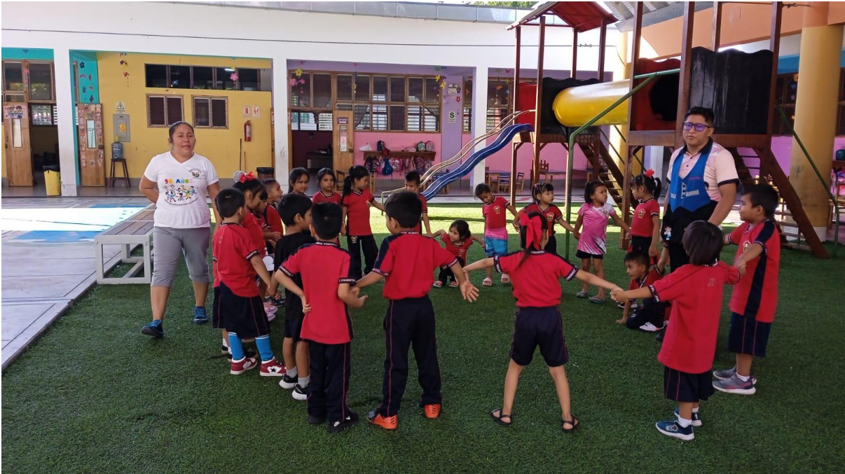
Imagen 01: Jugando el gato y el ratón: