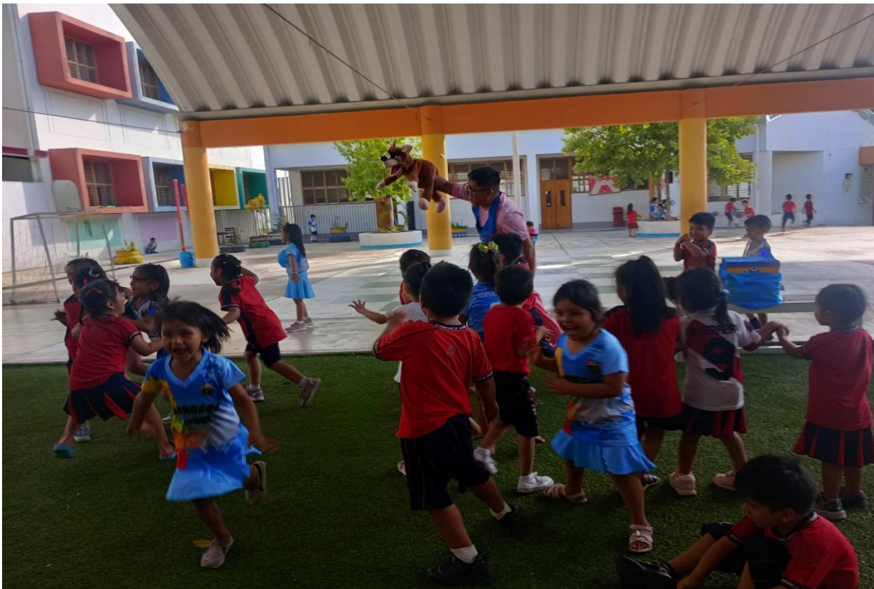
Imagen 03 y 04 : jugando el juego del lobo.