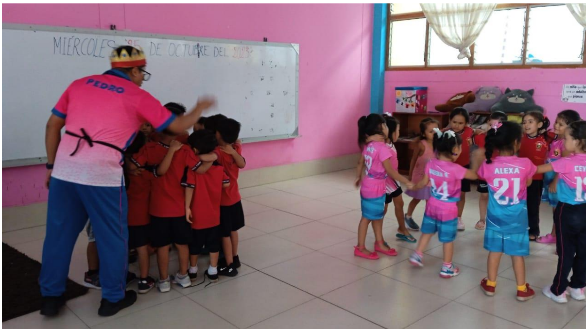
Imagen 02: Jugando el rey manda.