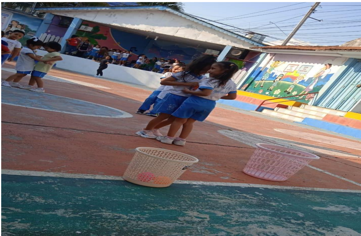
Imagen 4. Jugando tumba lata, esperando su turno para lanzar la pelota, con la finalidad de medir su control de sus emociones.