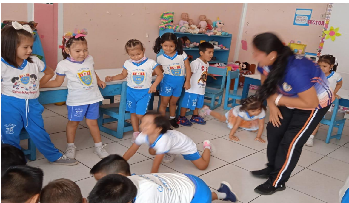
Imagen 2. Jugando con el dado de las emociones

Imagen 1. Realizando una actividad divertida antes de iniciar la clase para activar sus ánimos.