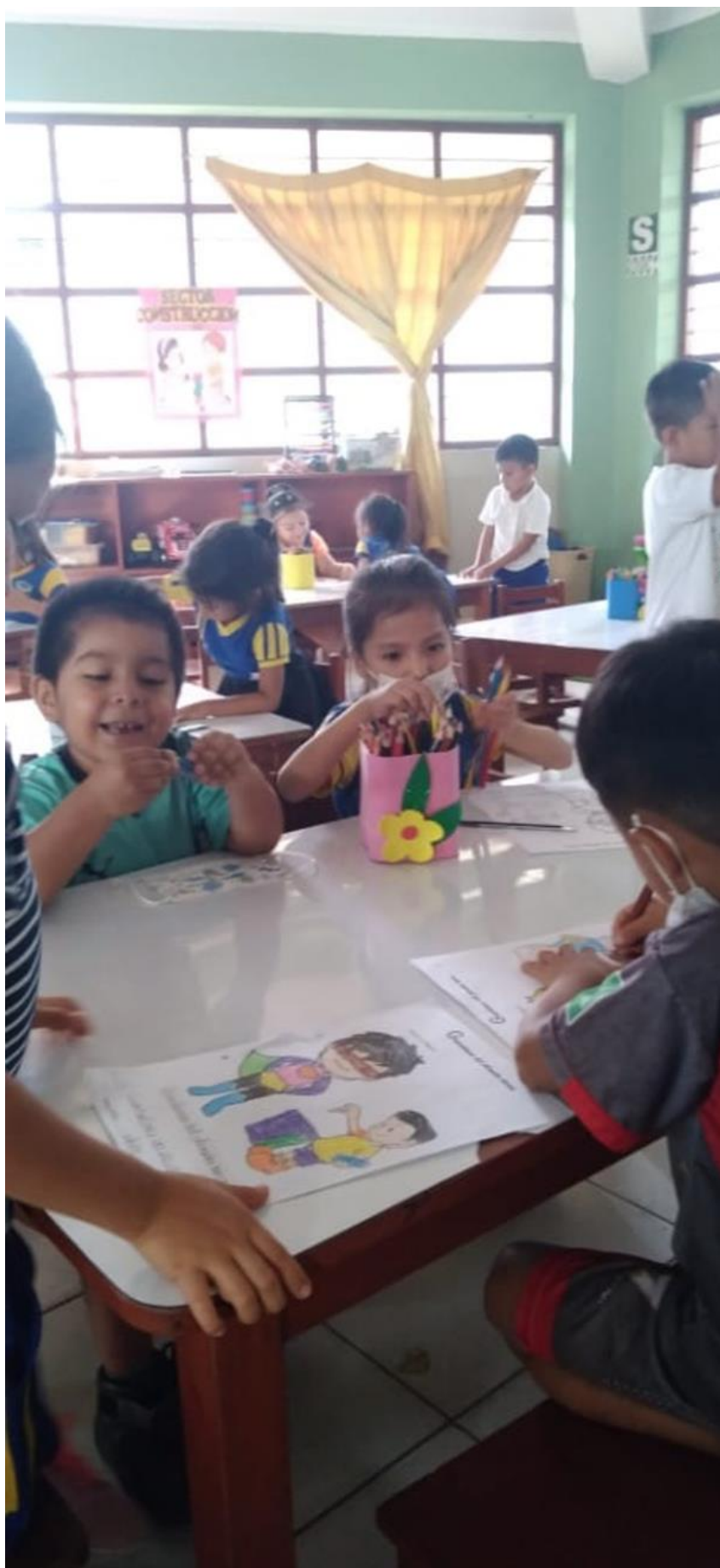
Los niños concentrados pintan los personajes del cuento “Chepito”