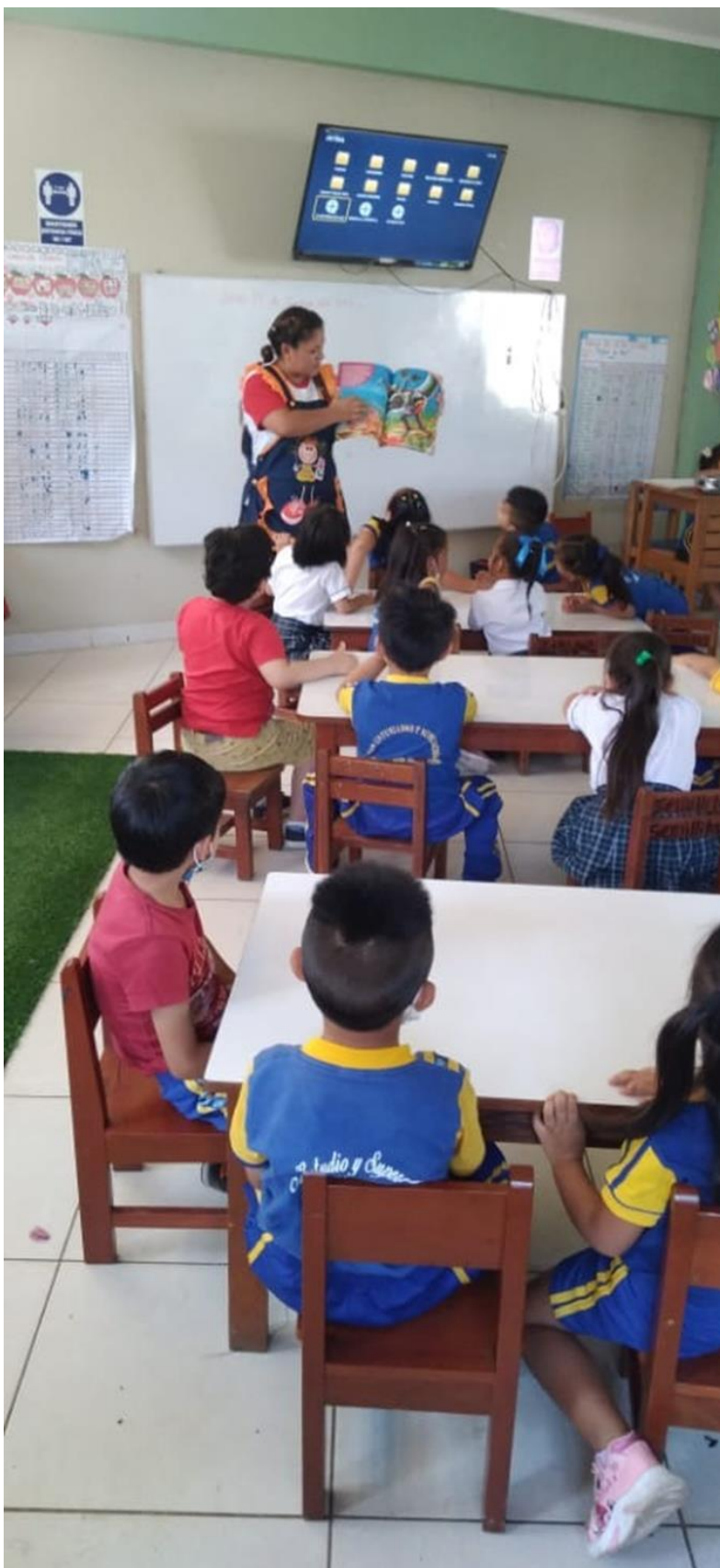
Atentos al cuento