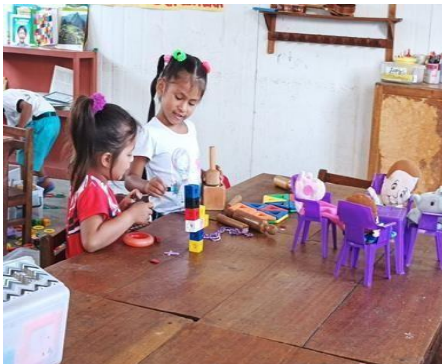
Figura 3: Niñas de 5 años realizando juegos en el sector hogar