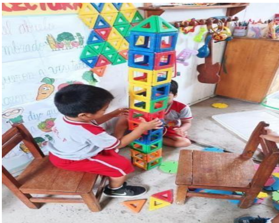
Figura 2: Niños de 5 años realizando juegos tranquilos utilizando los bloques imantados