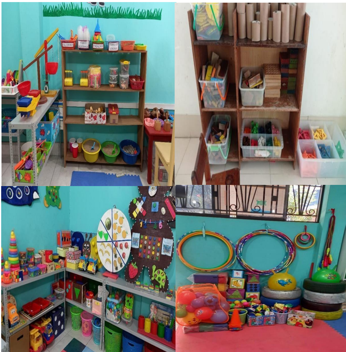
Figura 1: Sectores de aprendizaje del aula de recurso del Programa de Estudio de Educación Inicial