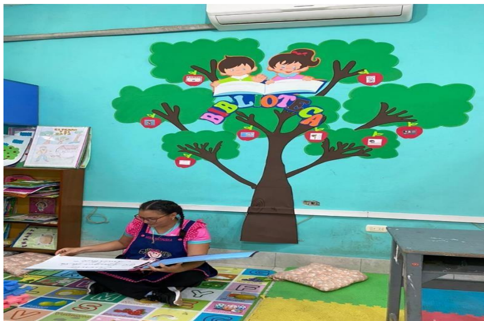
Figura 1: Estudiante practicante leyendo un cuento en el sector biblioteca en el aula de recursos.