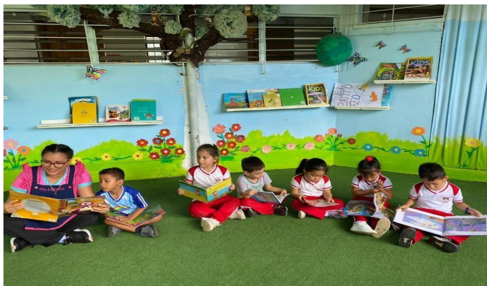
Figura 2: Estudiante practicante leyendo un cuento a los niños y niñas de 5 años.