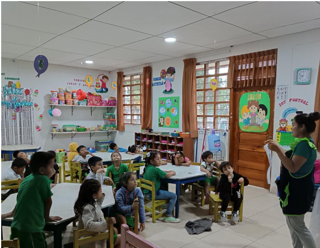
Evidencia 1. Mostrando la canción como estrategia de enseñanza.