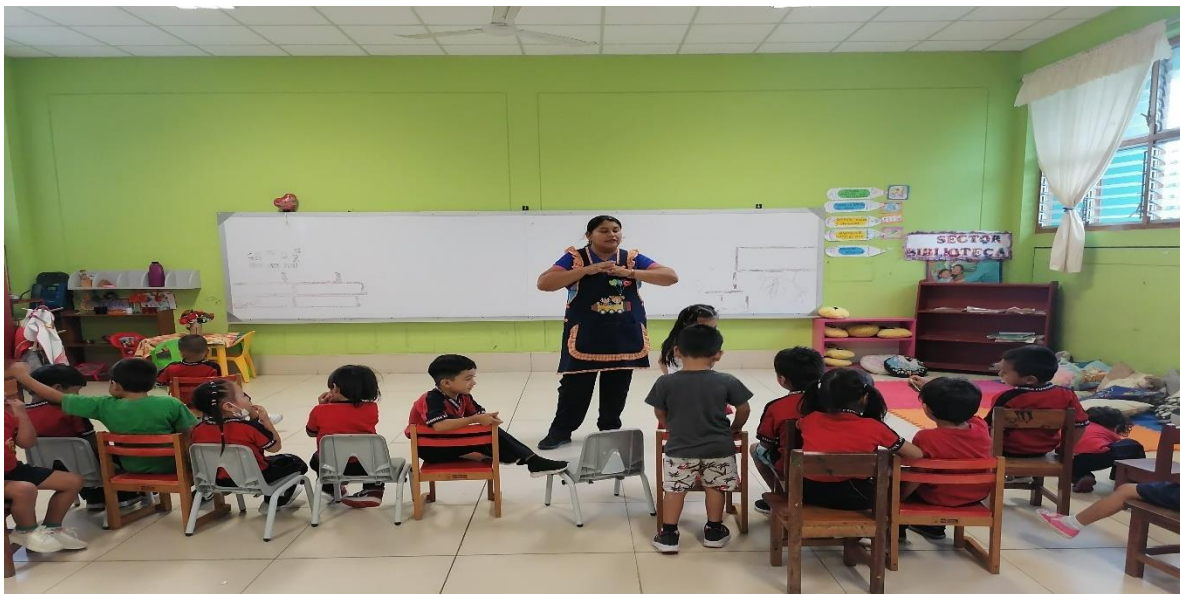
Evidencia 2. Realizando el juego como estrategia de enseñanza.