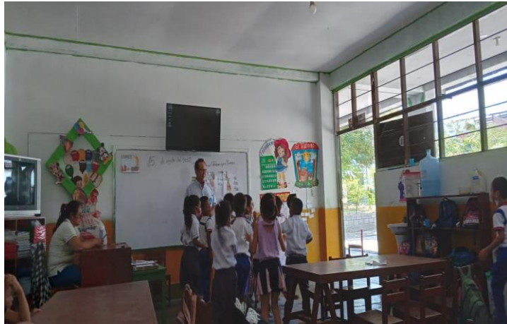
“El pollito Juanito pide que cierres tu ojito”