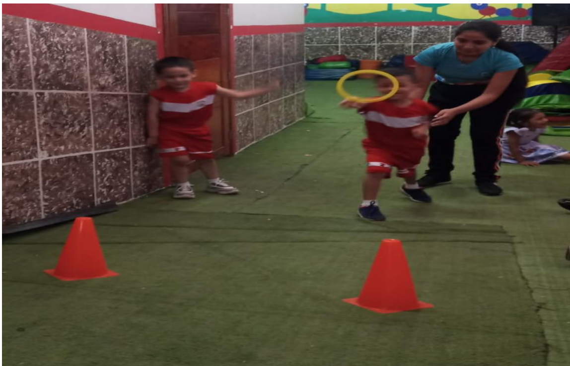
Ilustración N° 1: Niños de 5 años con lanzamientos de aros.