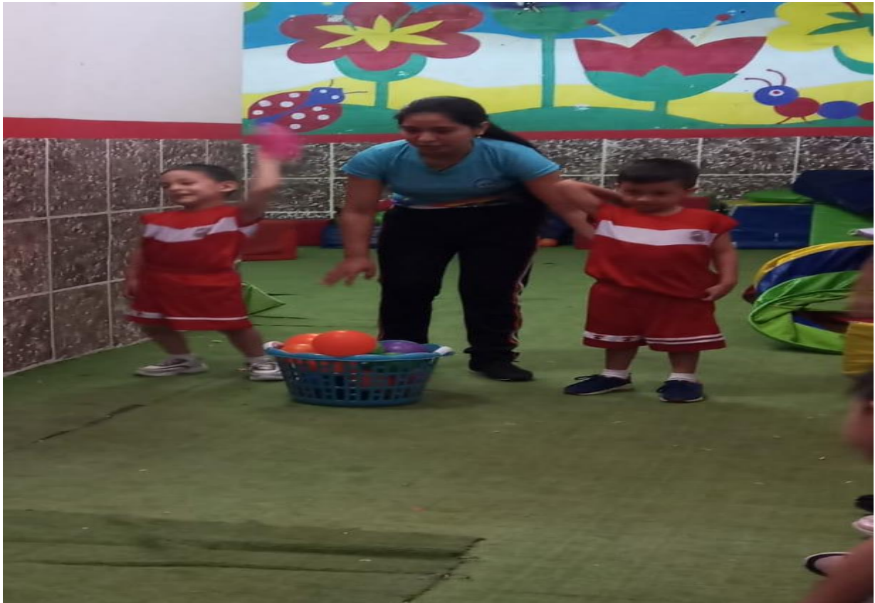
Ilustración N° 3: Niños de 5 años con lanzamientos de pelotas