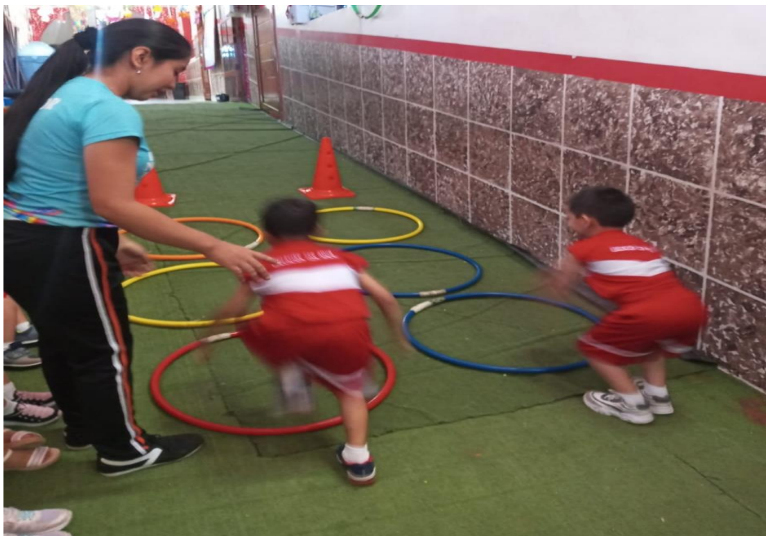
Ilustración N° 4: Niños de 5 años saltando las hula hula.