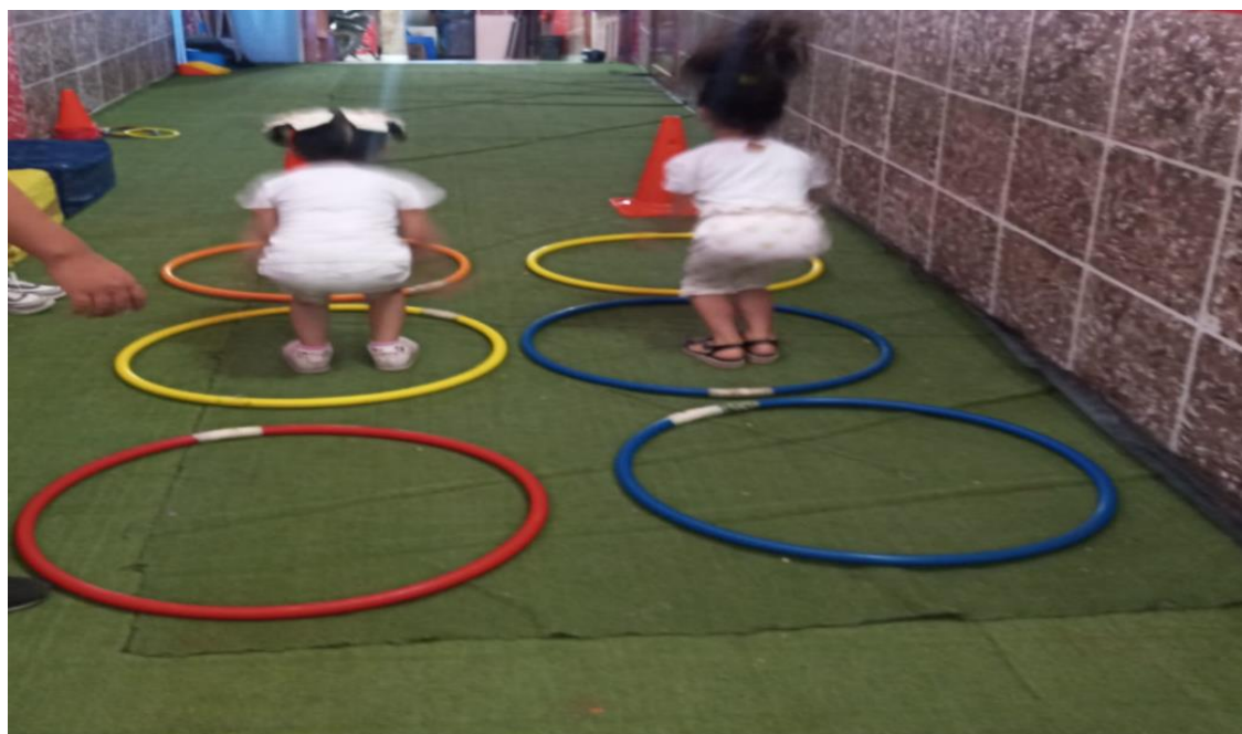
Ilustración N° 2: Niños de 5 años saltando las hula hula