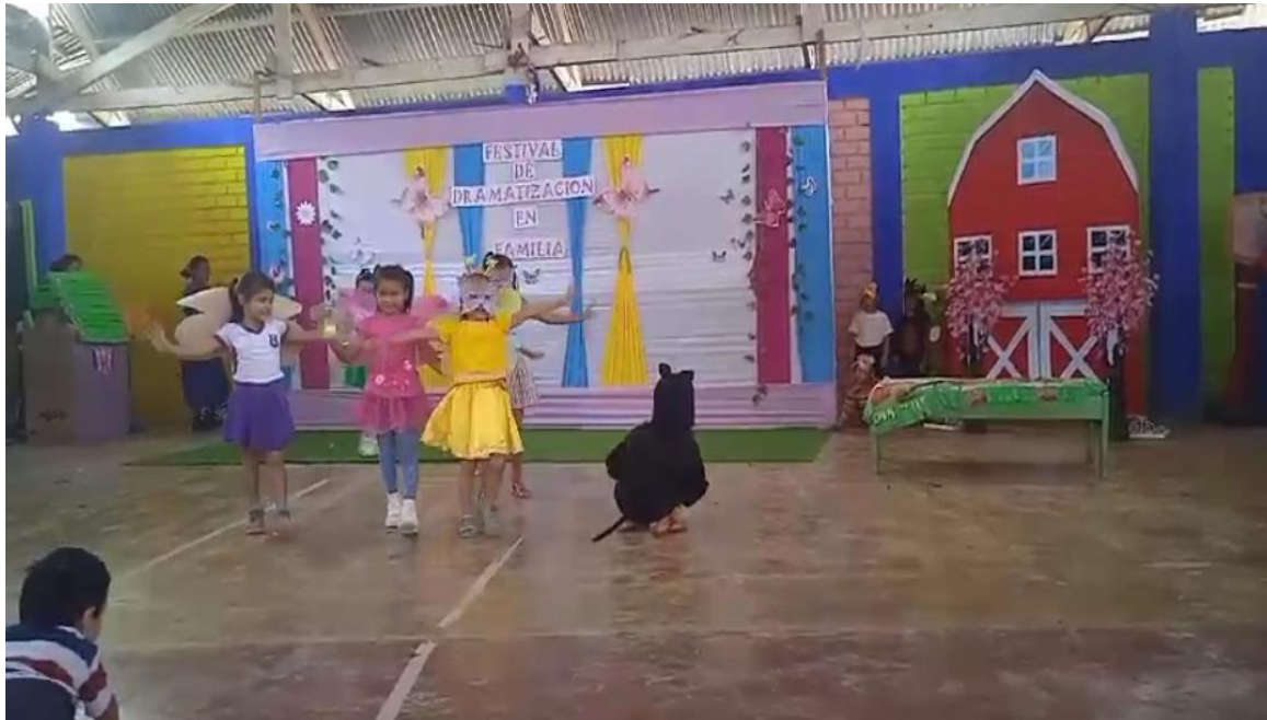
Figura 3: Dramatización