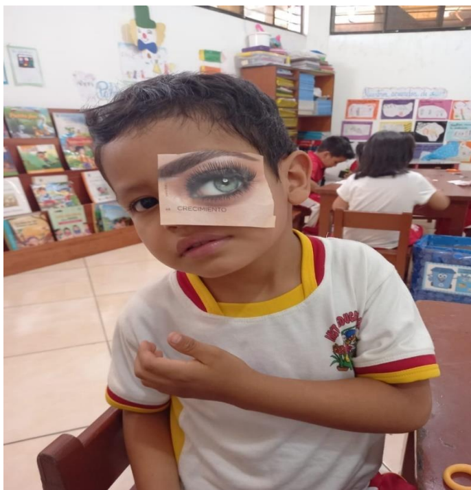
Figura 4: Recortado

Nota: Fotografía tomada en la Institución Educativa Inicial N°327-Partido Alto-Tarapoto, a niño de 4 años de la sección Amorosos durante el taller.