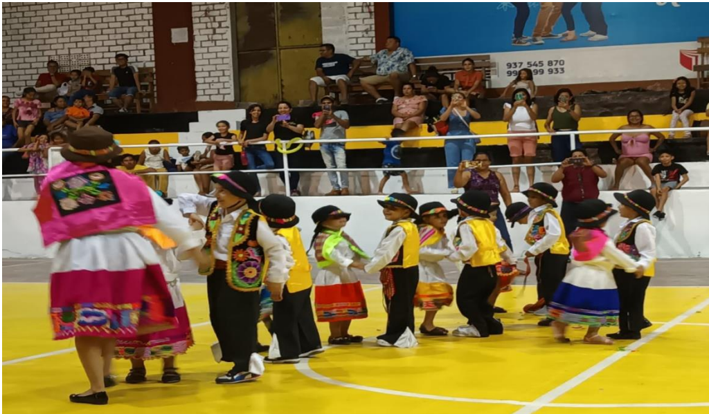
Figura 1: Danza

Nota: Fotografía tomada en la Institución Educativa Inicial N°327-Partido Alto-Tarapoto, a los niños de 4 años, sección Bondadosos durante el festival de danza.