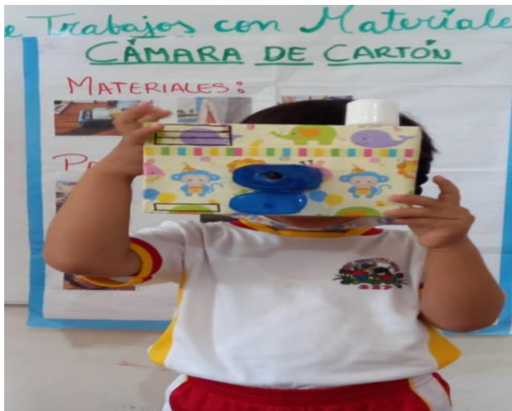
Figura 2: Experimentación con materiales poco convencionales

Nota: Fotografía tomada en la Institución Educativa Inicial N°327-Partido Alto-Tarapoto, a los niños de 4 años, sección Bondadosos, en la exposición de trabajos con materiales reciclados.