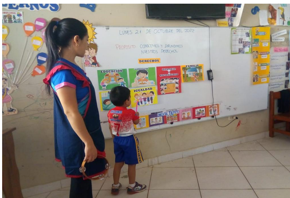
Figura 2: Niño de la sección Solidarios haciendo lectura de imágenes