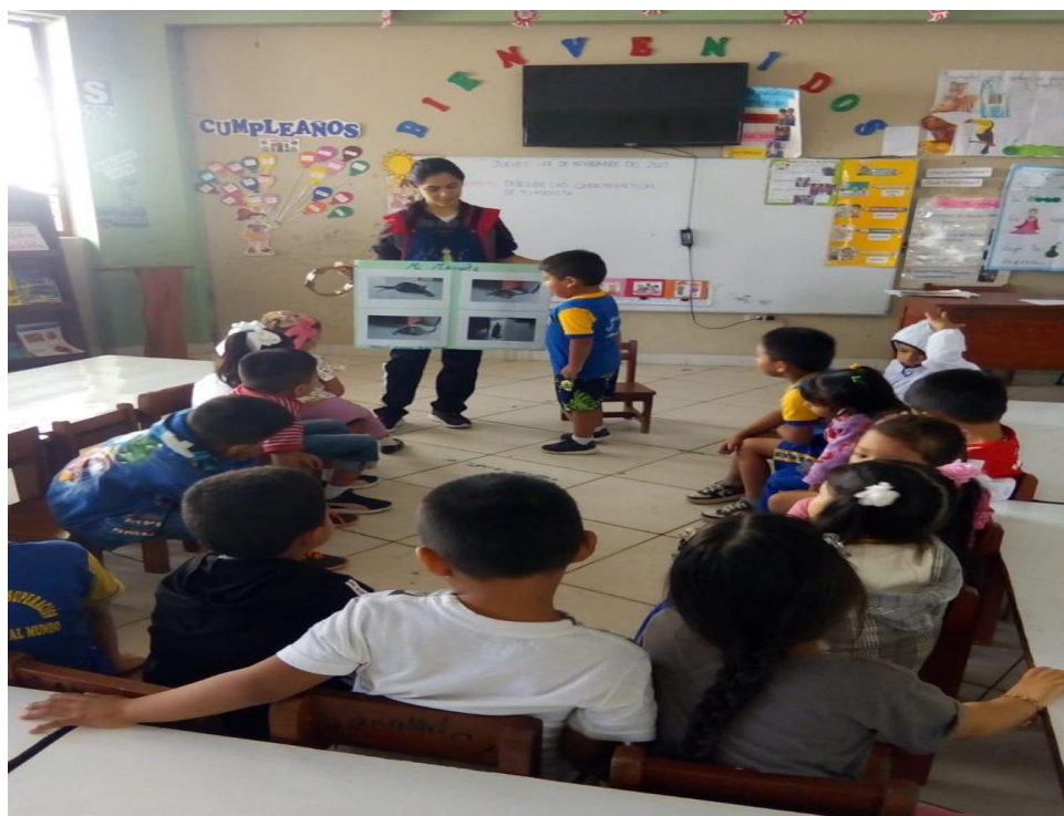
Figura 1: Niño de 5 años exponiendo su trabajo realizado